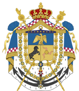
Lo stemma del Regno di Gioacchino Murat

L'Associazione Gioacchino Murat Onlus anche nel 2010 prosegue nella sua missione di tutela e promozione della storia e della cultura. Le Giornate Murattiane del 2010 si articolano in tre periodi diversi. In primavera, ed esattamente il 25 maggio, s'inizierà con il Bicentenario della prima venuta del Re Gioacchino Murat a Pizzo in occasione della quale donò 2000 ducati alla Chiesa di San Giorgio. Proseguirà con gli «Incontri Culturali di Mezza Estate», giunti ormai alla Terza Edizione. Finirà con la Campagna d'autunno in cui verranno rievocati i tragici avvenimenti realmente svoltisi a Pizzo dall'8 al 13 ottobre del 1815. Il termine del Programma è previsto per il 13 ottobre con il ricordo della fine del Re, dapprima con una cerimonia civile al Castello e, di seguito, con una S. Messa alla Chiesa di San Giorgio Martire.